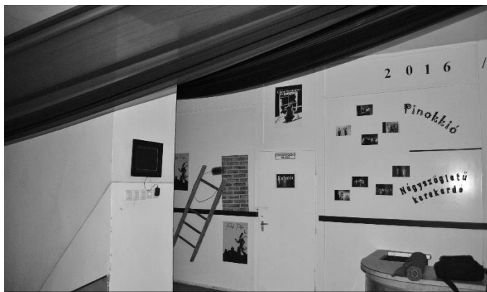
A felújított és átalakított kultúr folyosója

- Szeretném erősíteni ezt a missziót is, ötvözve a többivel, és Marótvölgyében létre hozni egy tehetségközpontot, mely a gyerekekből fakad, és melyben nekünk annyi a dolgunk, hogy szeretettel gondoskodjunk róluk.