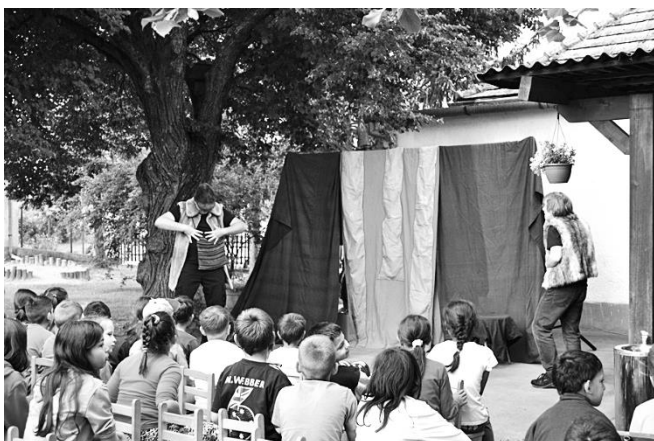
Meseelőadás a sávolyi óvodában

Az elért eredmények nagyon biztatóak és reméljük, hogy hosszú távú együttműködés, közös munkálkodás alakul ki a falu és a társulat között. Személy szerint én nagyon örülök, hogy sikerült mindezt az értéket létrehozni a községben. Eddig is dolgoztam érte és ez után is azon leszek, hogy megtartsuk és fejleszteni tudjuk a színházat. Köszönöm szépen a beszélgetést és jó egészséget és sikeres munkát kívánok!