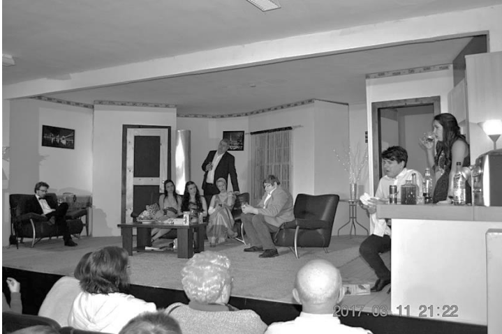
Pletyka című felnőtt bérletes előadás

A polgármester úrral, akkor már régóta jó viszonyt ápoltunk, és felmerült a kérdés részükről, hogy nem csinálnánk-e ott is előadásokat, mivel szeretnék, hogy a kultúra fontos pillére legyen a közösségüknek.