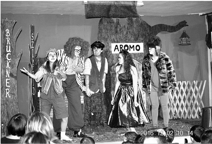
Lázár Ervin: Négyszögletű kerekerdő című meséjének előadása a sávoilyi gyerekeknek