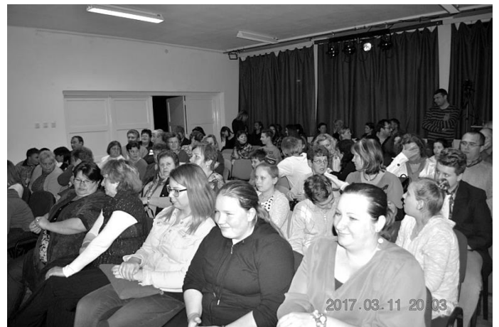
A Pletyka előadás közönsége