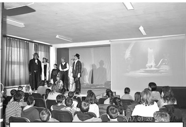
Pinokkió előadás a gyerekeknek